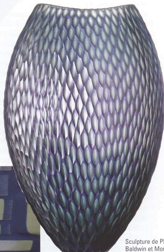
Sculpture de Philip Baldwin et Monica Guggisberg.