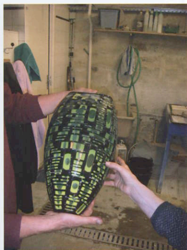
Une nouvelle œuvre du duo Baldwin/Guggisberg.