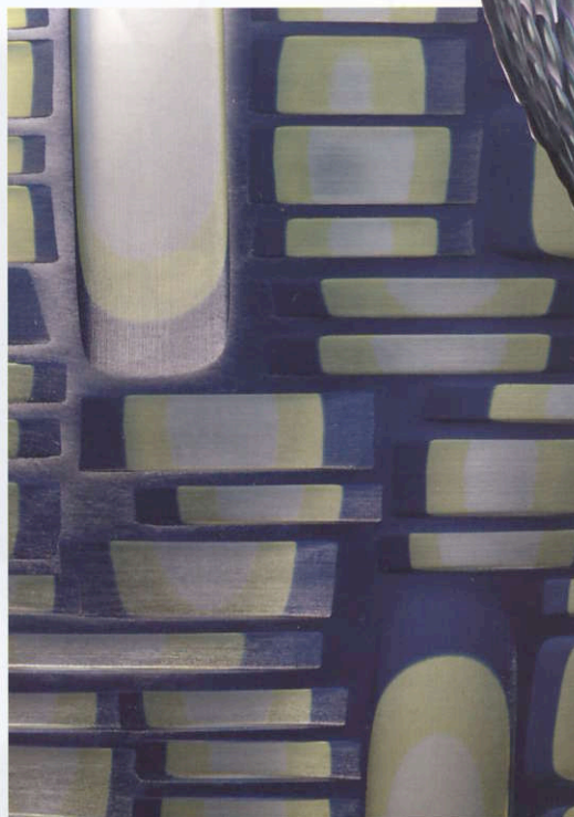
Détail d'une sculpture de Philip Baldwin et Monica Guggisberg.