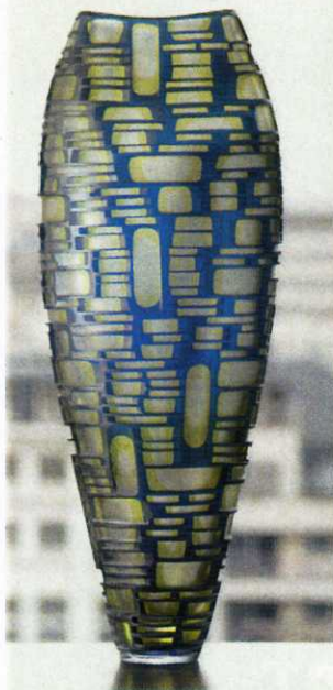
Vase Cadiz. Galerie Marc Heiremans